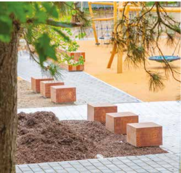
Des assises pour se poser

Après 6 mois de travaux, le square des Rossignols a rouvert le 7 juillet 2025 pour le plus grand plaisir des habitantes et habitants du quartier.