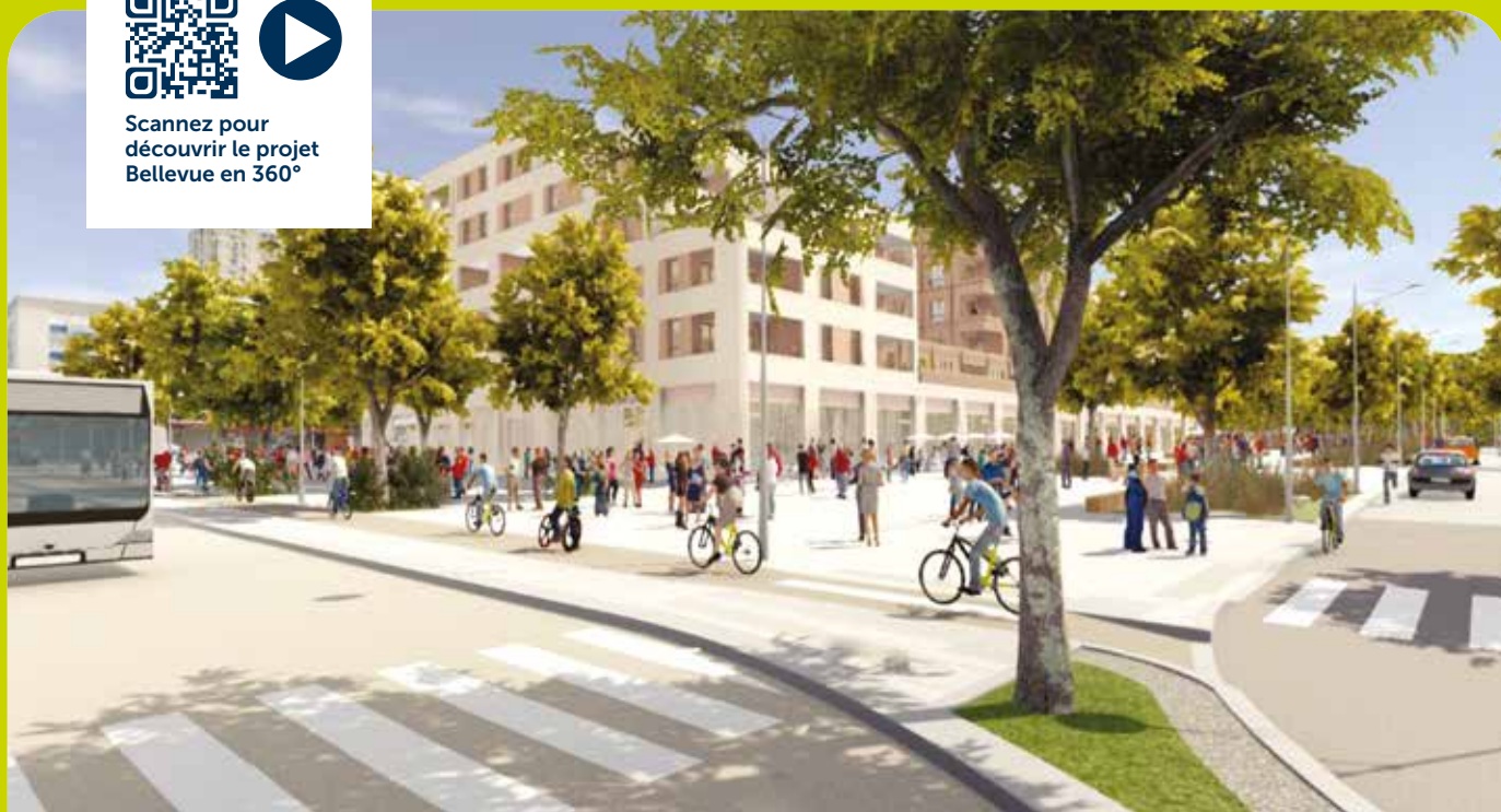
Rue des Sports et pôle d'échange multimodal

Scannez pour découvrir le projet Bellevue en 360°