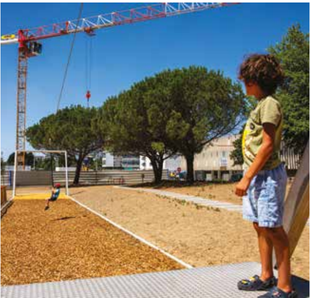
L'aire de jeux et la tyrolienne