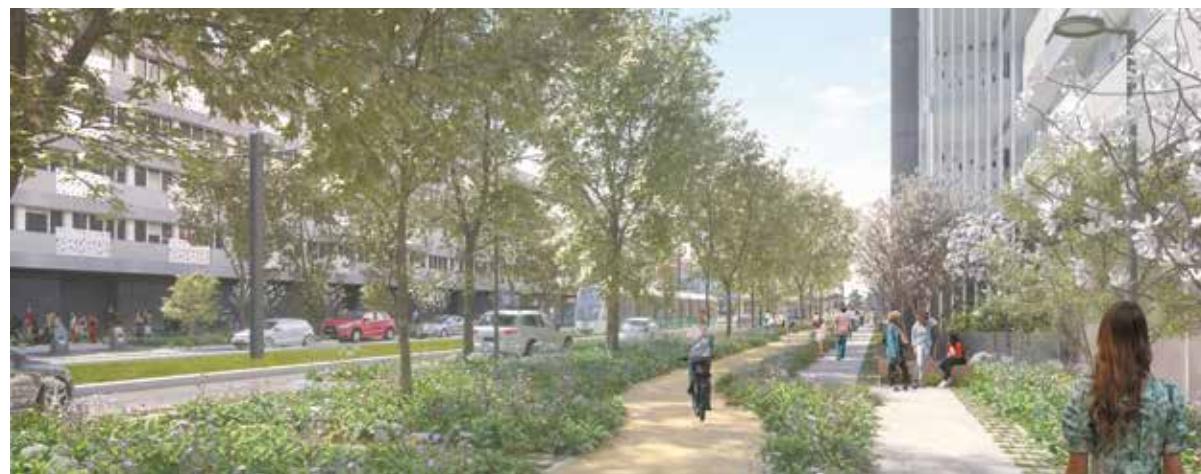
Vue perspective du boulevard Churchill nord réaménagé © D&A

La contre-allée sera définitivement fermée à la circulation automobile et le stationnement n'y sera plus possible. Le temps des travaux, les piétons devront emprunter les trottoirs côté est du boulevard, et la rue de Bordeaux sera mise en impasse. Une dizaine de places de stationnement publiques sera restituée à terme suite aux aménagements.