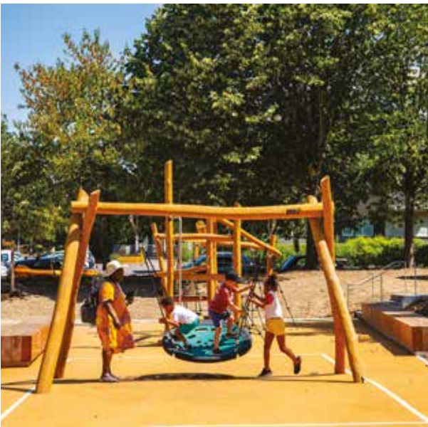
La balançoire