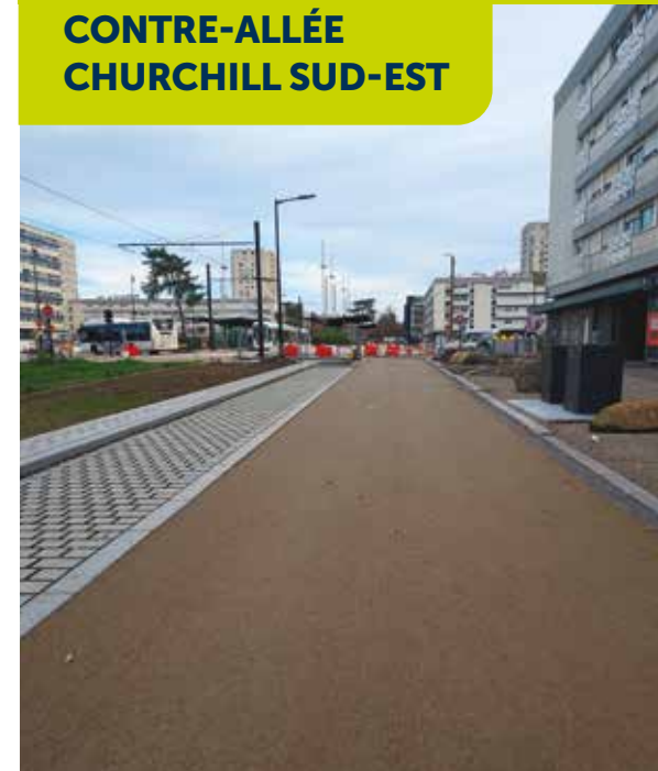
Boulevard Winston Churchill sud-est

De septembre à novembre 2025, des travaux ont eu lieu sur la contre-allée. Ils ont permis l'aménagement de :