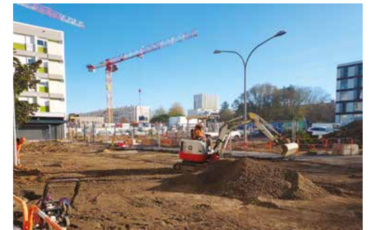
Parking des Rossignols