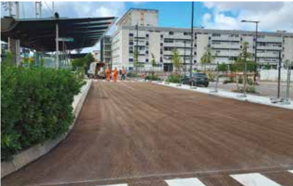
Station de tramway et bus côté Saint-Herblain