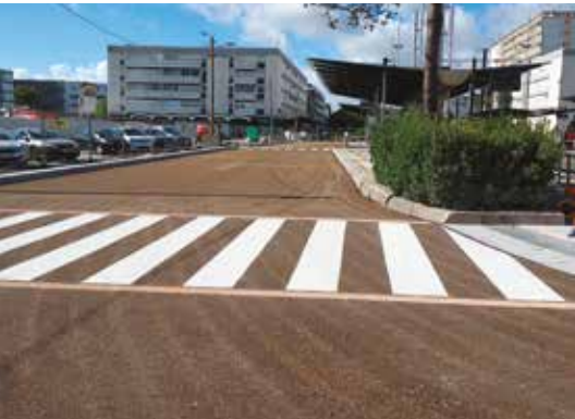
Station de tramway et bus côté Nantes

La coupure de la ligne 1 tramway pendant l'été a permis de refaire la station de tramway et bus. Les bus circulent depuis fin août 2025 sur un espace complètement réaménagé.