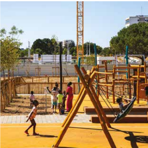
La balançoire