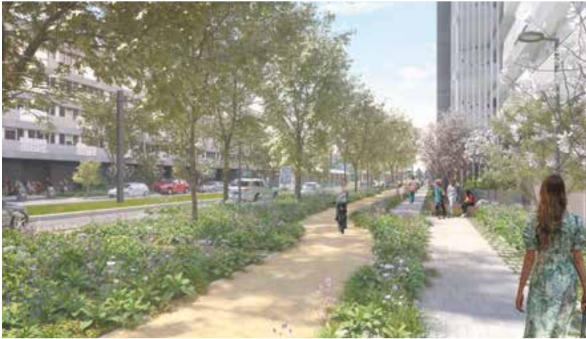
Vue perspective du boulevard Churchill nord réaménagé.

Des travaux sur la partie Nord-Est du boulevard vont s'engager à compter du 30 mars 2026 , et se poursuivront jusqu'à l'automne 2026. L'objectif : des déplacements plus apaisés pour tous les publics et plus de nature en ville.