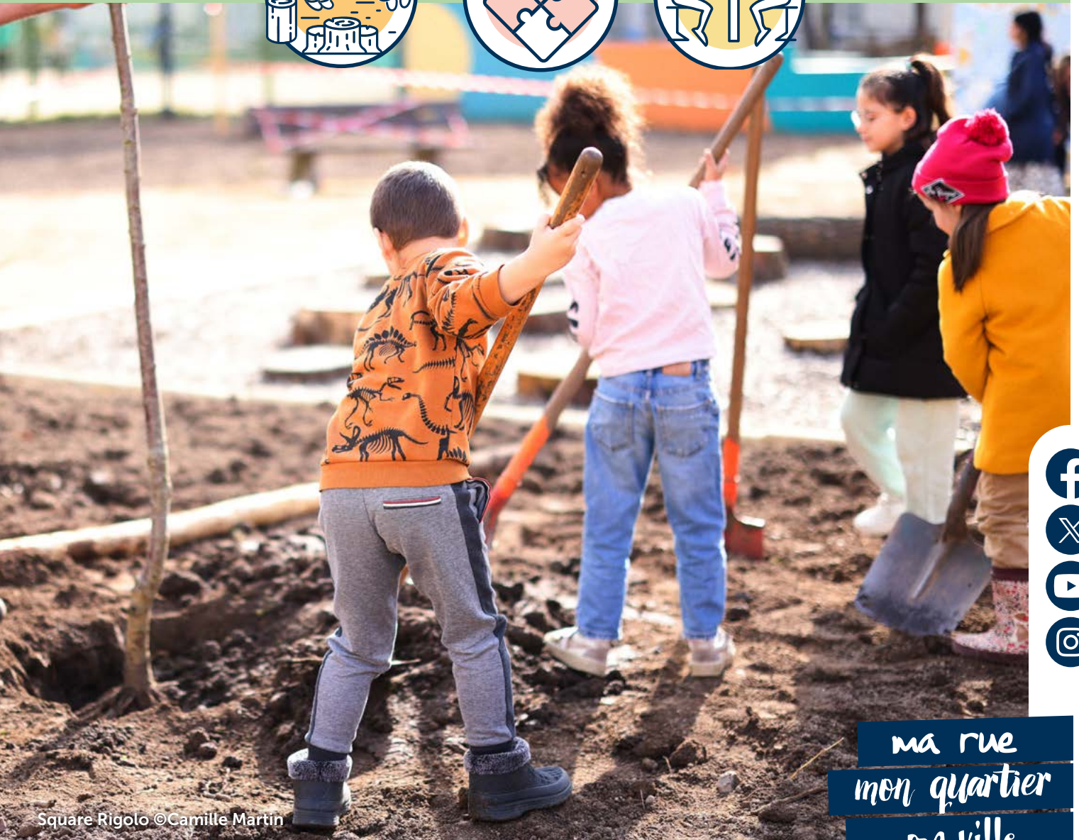
Square Rigolo