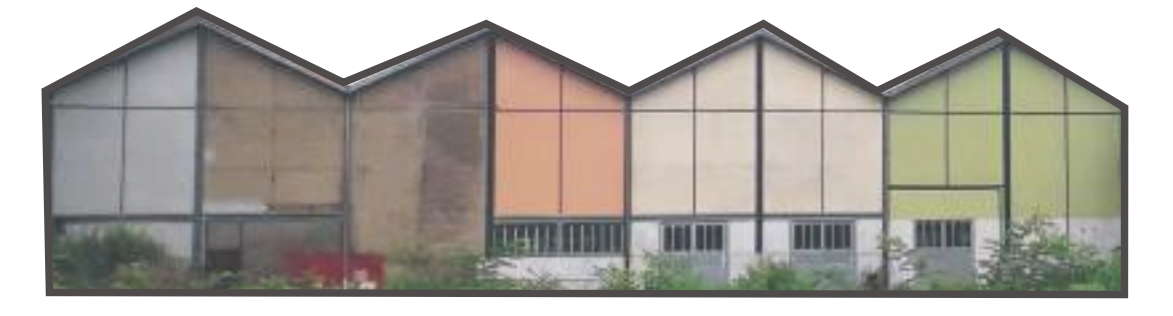
↑ Toitures existantes Halles / Nefs