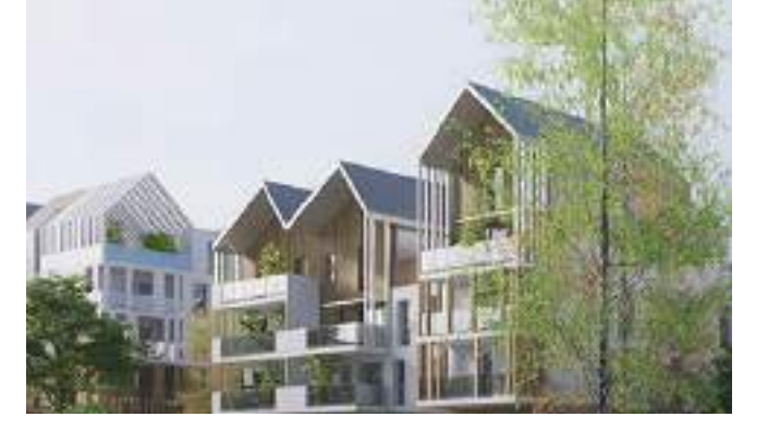
Avancée de toiture - Casquette ↑ 28 logements, Lagord (17) - Alterlab

Références Formes des toitures - Grands halls - Ouvertures sur la Loire