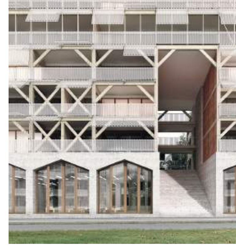
Logements, Munich - Nicolas Dorval-Bory