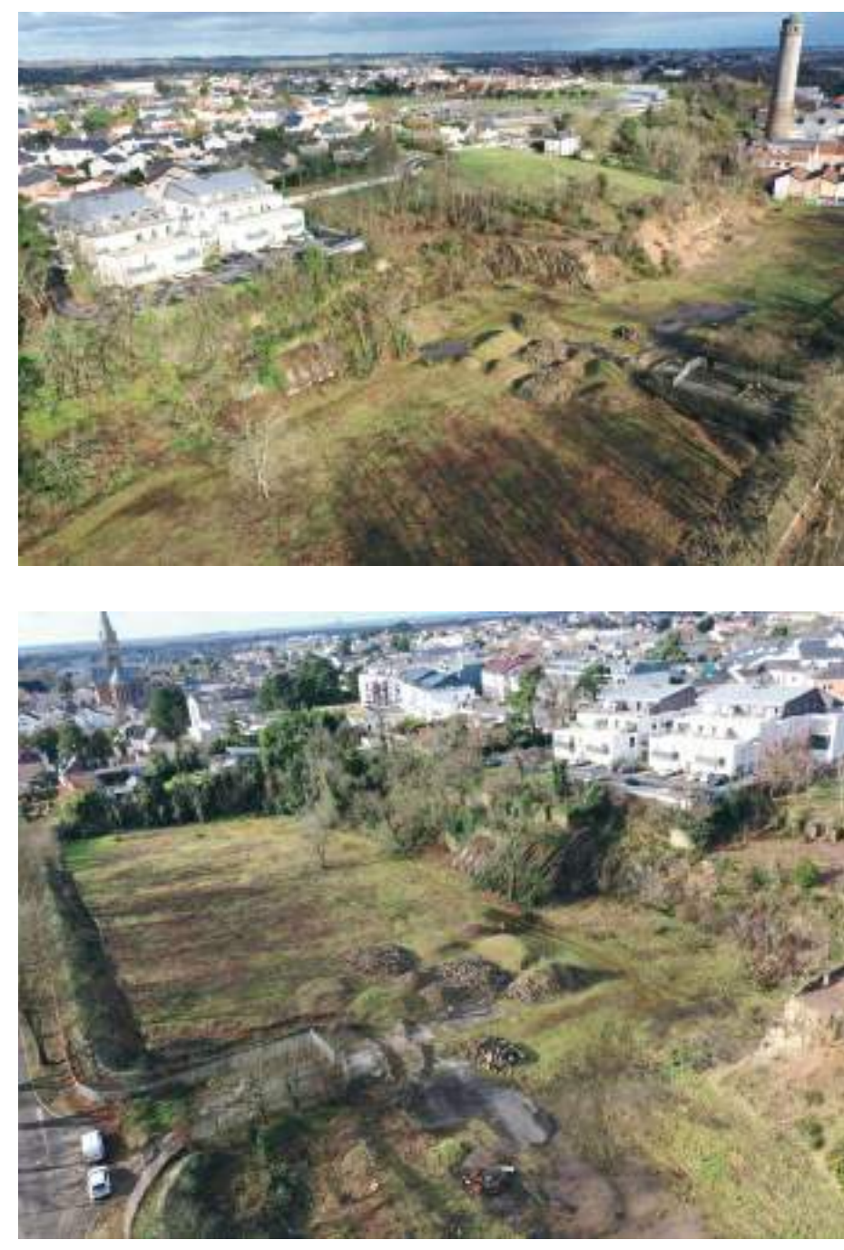
↑ Aujourd'hui, le secteur «Rives de Loire»