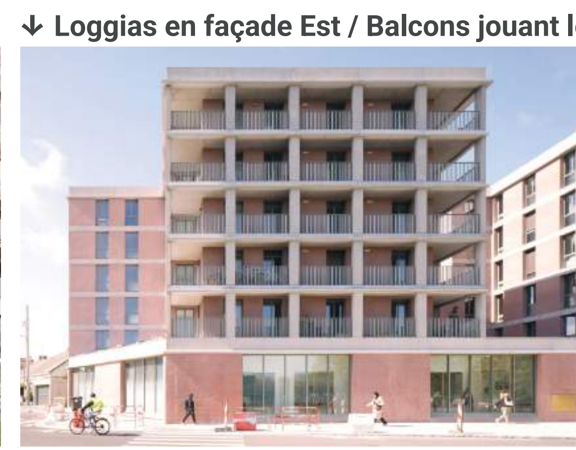
68 logements + pôle santé, Nantes (44) - Bourbouze & Graindorge