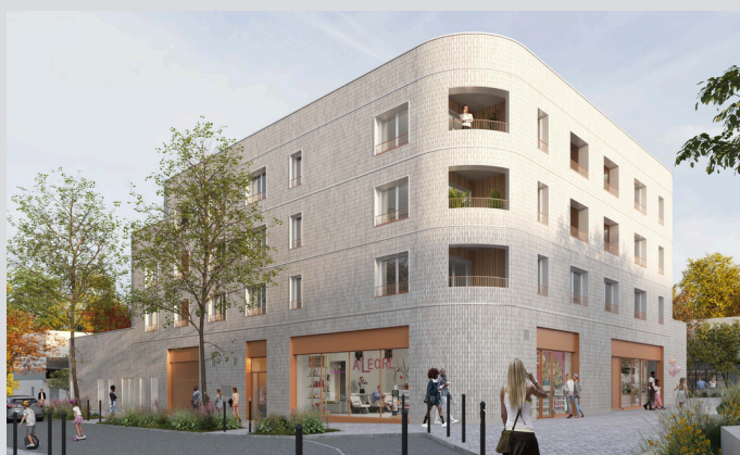
DERVALLIERES - Nantes Commerces à définir