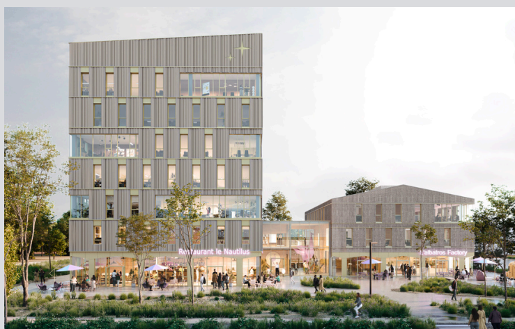
ETOILE DU SUD - Bouguenais Restaurants