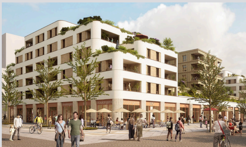
BELLEVUE - Nantes Boulangerie